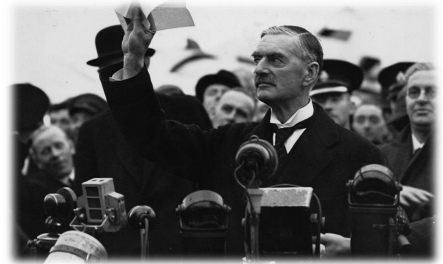
Neville Chamberlain, Primer Ministro Inglés (1938)